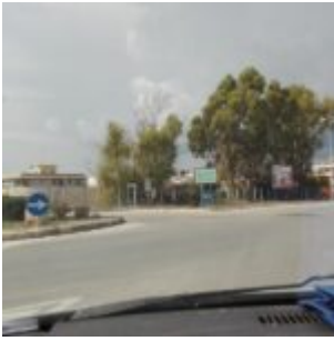
Prov. di Ragusa