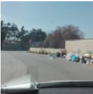
Prov. di Siracusa