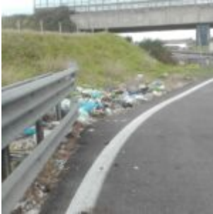
Prov. di Siracusa

Sarà che nelle foto del ragusano avremo indovinato proprio il giorno di pulizia e diserbo, sarà che i vicini ragusani hanno maggiore propensione al rispetto delle loro città e degli spazi comuni, sarà che il sistema di pulizia, diserbo e sfalcio in genere funziona meglio. Sarà quel che sarà, il dato è uno e salta all'occhio: a Ragusa c'è più attenzione, quella che a Siracusa manca. Non tutto, non sempre può essere colpa di fondi o risorse che non ci sono. Quando c'è la volontà della testa che pensa, la forza delle idee batte spesso il vil denaro.