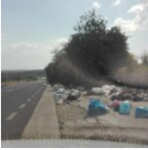
Prov. di Siracusa