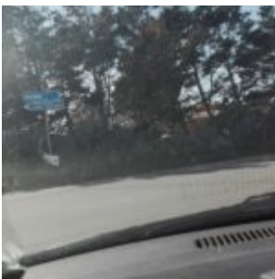
Prov. di Siracusa