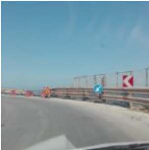
Prov. di Siracusa