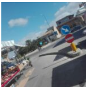
Prov. di Ragusa

Ma la differenza principale tra le foto (sotto una gallery) è che le prime due riguardano la provincia di Ragusa, quella in mezzo (ed altre in gallery) immortalano tratti di viabilità provinciale siracusana.