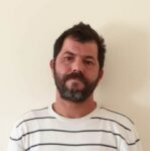
Sebastiano Violante foto copertina: dal web