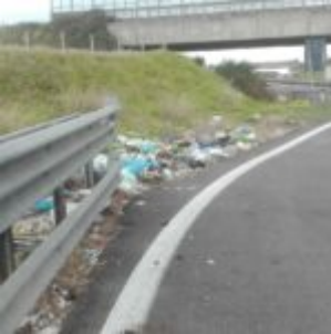
Prov. di Siracusa

Sarà che nelle foto del ragusano avremo indovinato proprio il giorno di pulizia e diserbo, sarà che i vicini ragusani hanno maggiore propensione al rispetto delle loro città e degli spazi comuni, sarà che il sistema di pulizia, diserbo e sfalcio in genere funziona meglio. Sarà quel che sarà, il dato è uno e salta all'occhio: a Ragusa c'è più attenzione, quella che a Siracusa manca. Non tutto, non sempre può essere colpa di fondi o risorse che non ci sono. Quando c'è la volontà della testa che pensa, la forza delle idee batte spesso il vil denaro.